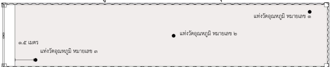
ภาพที่ ๑ ตำแหน่งการวางถังวัดอุณหภูมิผลไม้ภายในตู้ขนส่งสินค้าสำหรับการกำจัดศัตรูพืชด้วยความเย็นระหว่างขนส่ง